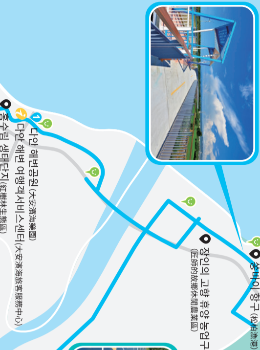
타이베이 항공 (台北飛機場) 타이베이 고강 철강 농업구 (台北鋼鐵農業區) 다산 해변공원 (大嵵港海濱公園) 다산 해변 여형서비스센터 (大嵵港海濱服務中心) 다산 하이그라운드 생태 교육 단지 (大嵵港海濱生態教育區) 다산 하이그라운드 생태 교육 단지 (大嵵港海濱生態教育區) 다산 하이그라운드 생태 교육 단지 (大嵵港海濱生態教育區) 다산 하이그라운드 생태 교육 단지 (大嵵港海濱生態教育區)