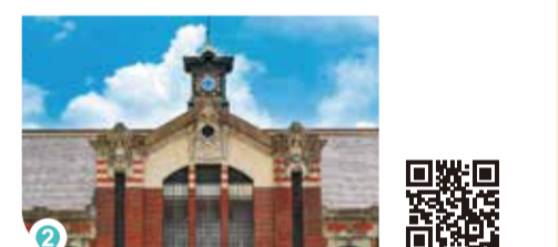
台中駅鉄道文化園區

緑空鉄道1908 コース距離 1.6 km コース所要時間 10 分間 交通手段 台中駅沿線から出発できます。