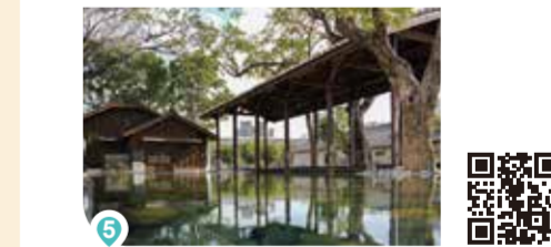
国家漫画博物館準備室

もともとは台湾初の化粧品工場でした。今では新興ブランドの集まる空間となっているほか、ミシュランに掲載されたレストランも入居しています。