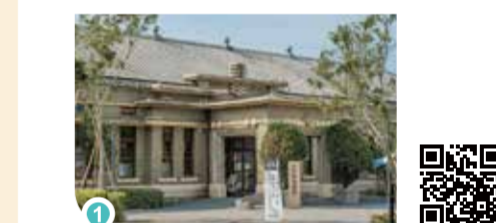
帝國製糖廠台中營業所

緑空廊道 コース距離 21.7 km コース所要時間 1.5 時間 交通手段 豊原駅から大慶駅までの沿線にある駅から出発できます。